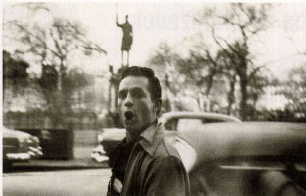
» Jack Kerouac Manhattanben (1953)

„Láttam nemzedékem legjobb elméit az örület romjaiban” – az irodalom-szerető olvasó már 1967-ben az Üvöltés kezdősorát idézte, és saját kortársaira gondolt. Amit Ginsberg kimondott – a lélegzetvételre lüktető sorok, a szürrealis képek, az élőbeszéd spontaneitása, a harsányság, a trágárság is – felszabadítóan hatott az akkoriban szemérmes magyar költészetre és az elnyomásban élő társadalomra. Az Üvöltés antológiát a pult alól kellett beszerezni, és ronggyá olvasták a fiatalok, 1970-ben pedig Jack Kerouac Úton című kultikus regénye is napvilágot látott. A hivatalos kritika a művek társadalombírálatát dicsérte, a velejéig rohadt kapitalizmus leleplezését, amelyet csak alkohol- és drogmármorban lehet elviselni. Az akkori szó-