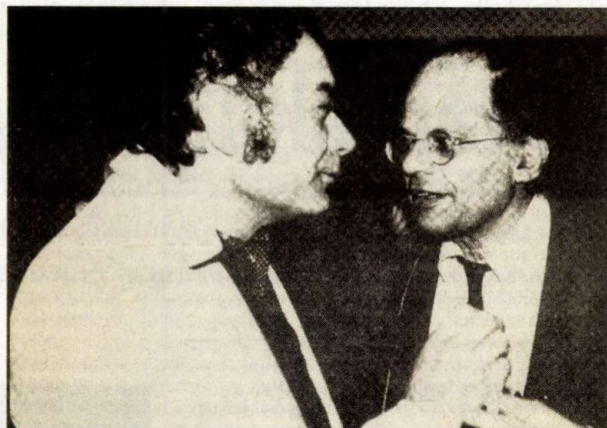
» Csoóri Sándor és Allen Ginsberg 1980-ban Budapesten